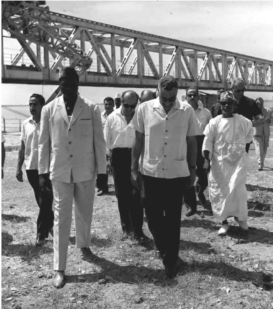
عبد الناصر مع الرئيس موديبو كيتا في قناطر مركالا وهي احدى المشروعات الصناعية على النيل في مالي

- قطع العلاقات مع الدول الإفريقية التي تبقى قواتها في الكونغو بعد سحب قواتنا.